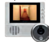
MICROVISEUR NUMÉRIQUE (en option)