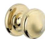
POMMEAU (en option) PVD laiton poli ou chromé velours