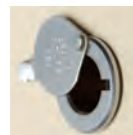
MICROVISEUR Chromé ou laiton