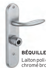
BÉQUILLE Laiton poli ou chromé brossé