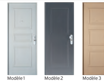
Modèle 1 Modèle 2 Modèle 3