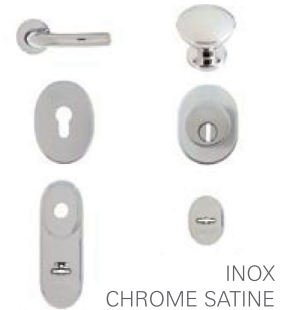
INOX CHROME SATINE