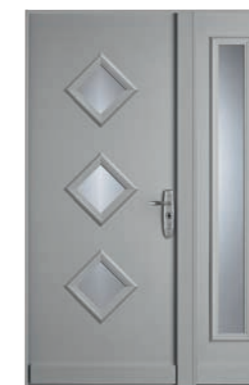
Forstyl SL SIMPLE VANTAIL + PARTIE FIXE LATÉRALE