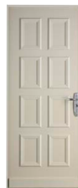
Forstyl HiS SIMPLE VANTAIL HAUTE RÉSISTANCE (SANS VITRAGE)