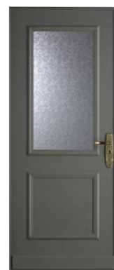
Forstyl S SIMPLE VANTAIL